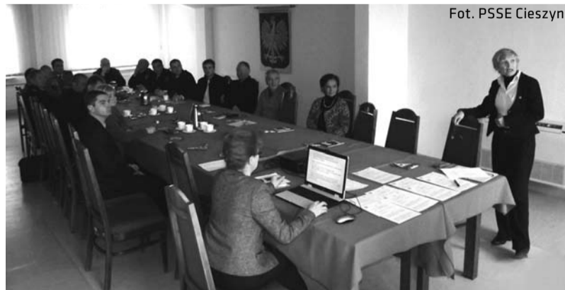
Projekt powstał w związku z niepokojącą sytuacją epidemiologiczną dotyczącą palenia tytoniu w Polsce