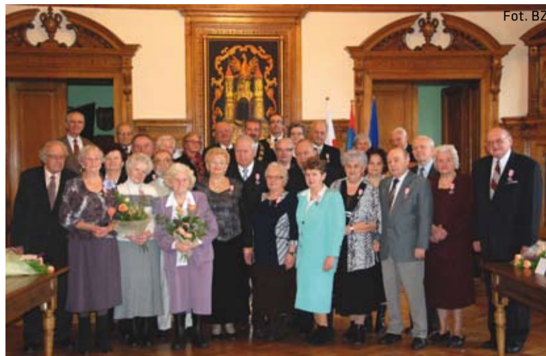
Pamiątkowe zdjęcie małżonków

Część artystyczną wypełnił piękny występ przygotowany przez Panię wychowawczynię i dzieci z cieszyńskiego Katolickiego Przedszkola im. Dzieciątka Jezus, na który złożyły się regionalne pieśni i tańce. Dzieci wręczyły własnoręcznie przygotowane upominki. Uroczystość była również okazją do spotkania z Burmistrzem, rozmów, wspomnień w gronie bliskich i znajomych oraz pamiątkowych zdjęć.