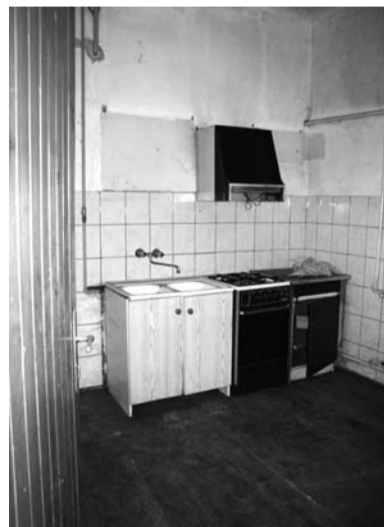
Lokal mieszkalny przy ul. Sejmowej 14 przeznaczony do sprzedaży

Bliższych informacji w tej sprawie można zasięgnąć pod nr tel. 33/4794230 lub 4794232.