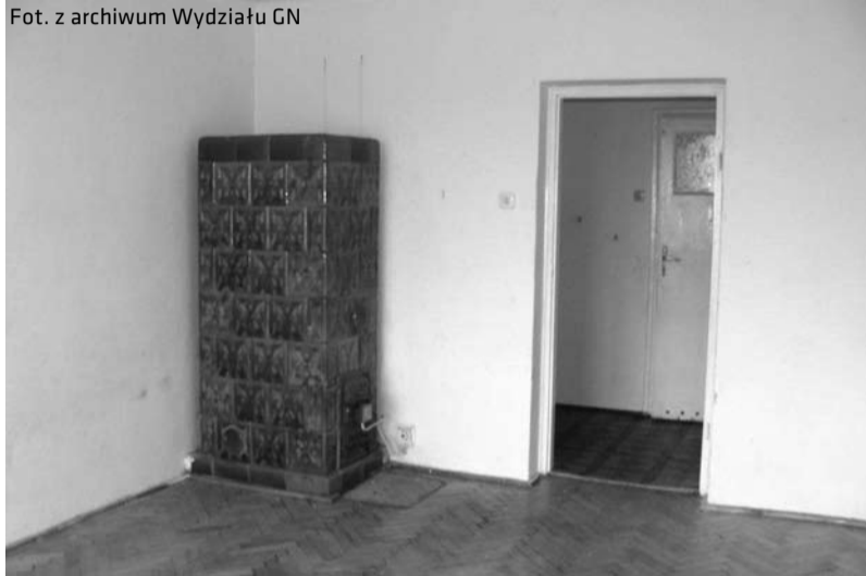
Lokal mieszkalny przy ul. Solnej 10 przeznaczony do sprzedaży

Burmistrz Miasta Cieszyna ogłasza, że 25.01.2012 r. o godz. 10.00 odbędzie się II publiczny ustny przetarg nieograniczony na zbycie lokalu mieszkalnego nr 2 o pow. 95,81 m 2 położonego w budynku przy ul. Głębokiej 62 w Cieszynie.