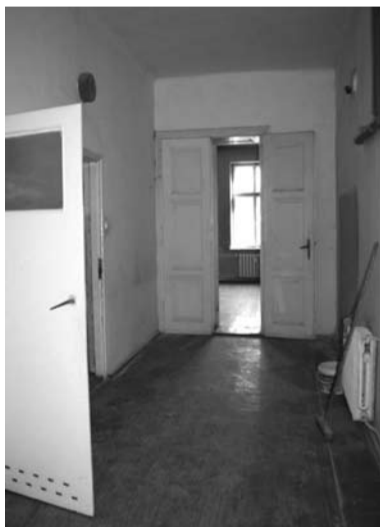
Lokal mieszkalny przy ul. Głębokiej 62 przeznaczony do sprzedaży

Bliższych informacji w tej sprawie można zasięgnąć pod nr tel. 33/4794230 lub 4794232.